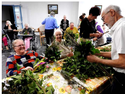
Stanovalci doma Taber v Šmartnem pri izdelovanju butaric

Pri krizmeni maši škof z zborom duhovnikov blagoslovi krstno in bolniško olje, posveti pa sveto krizmo ( po kateri krizmena sveta maša nosi ime ), ki se uporablja za krščevanje, birmovanje in posvečenje duhovnikov.